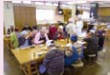
男性のための お料理講座の様子

ワークルーム 広さは192平方メートル。料理の実習をはじめ多目的にご利用いただけます。