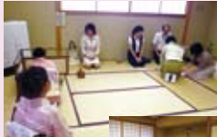
▲お茶会の様子 (中央区ブーケ祭りより)