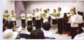
▲合唱の様子(中央区ブーケ祭りより)